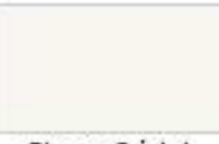
Blanco Cristal Perlado Mica